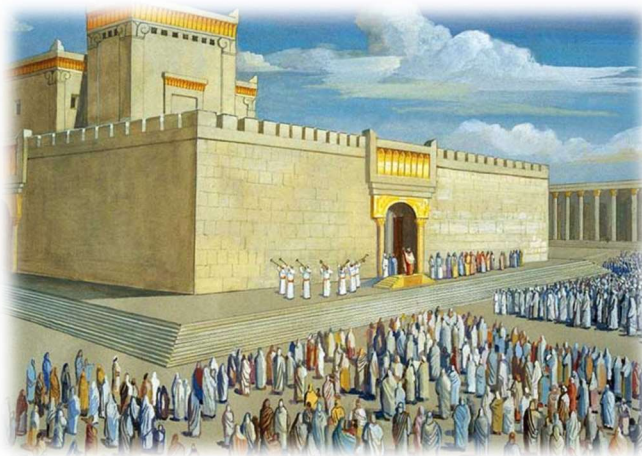
Dedicarea templului lui Solomon

„Toți copiii lui Israel au văzut pogorându-se focul și slava Domnului peste casă; ei și-au plecat fața la pământ pe pardoseală, s-au închinat și au lău-dat pe Domnul, zicând: „Căci este bun, căci îndu-rarea Lui ține în veac!” (II Cronici 7:3)