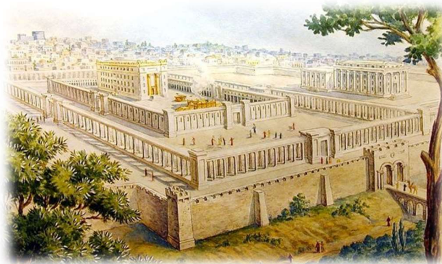
Templul lui Solomon