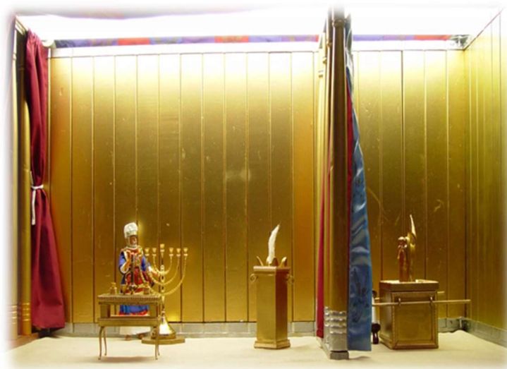
Locul sfânt și locul preasfânt din templu